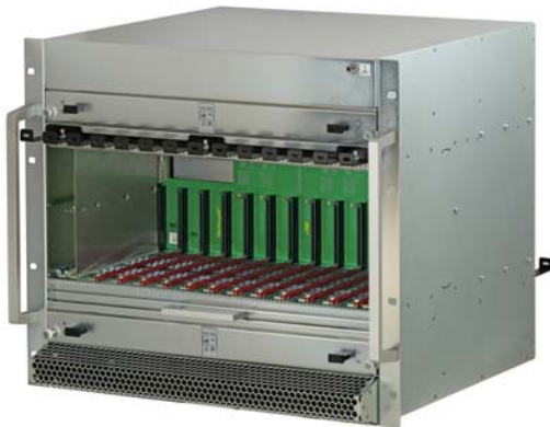
Frontansicht 9 HE