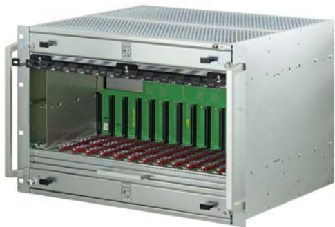
Frontansicht 7 HE